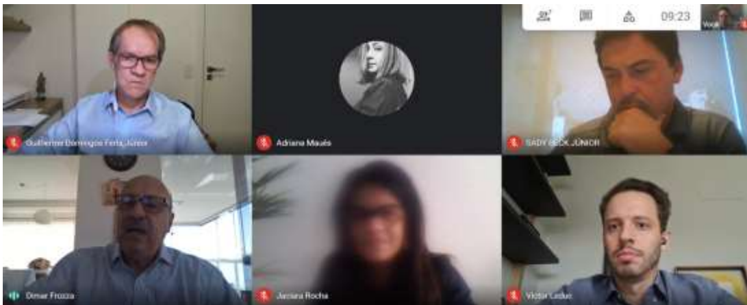
Reunião com o Secretário de Transparência, Auditoria e Controle Sady Beck