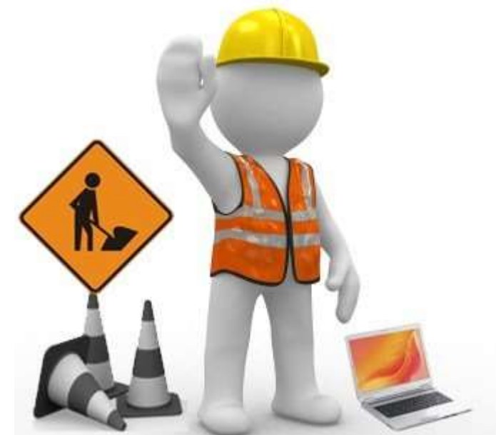
Reunião com o Secretário de Infraestrutura Galina